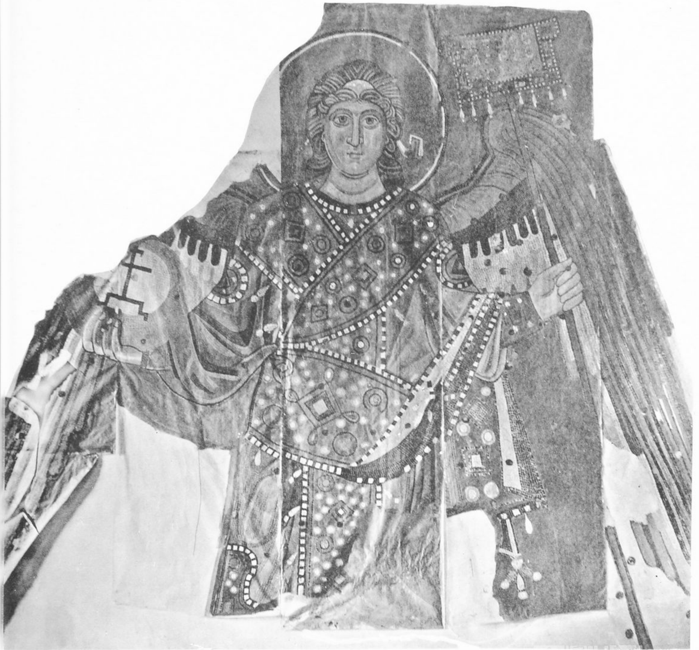
Фото Гравюра Шерера, Наблюдения Князя Москвит.