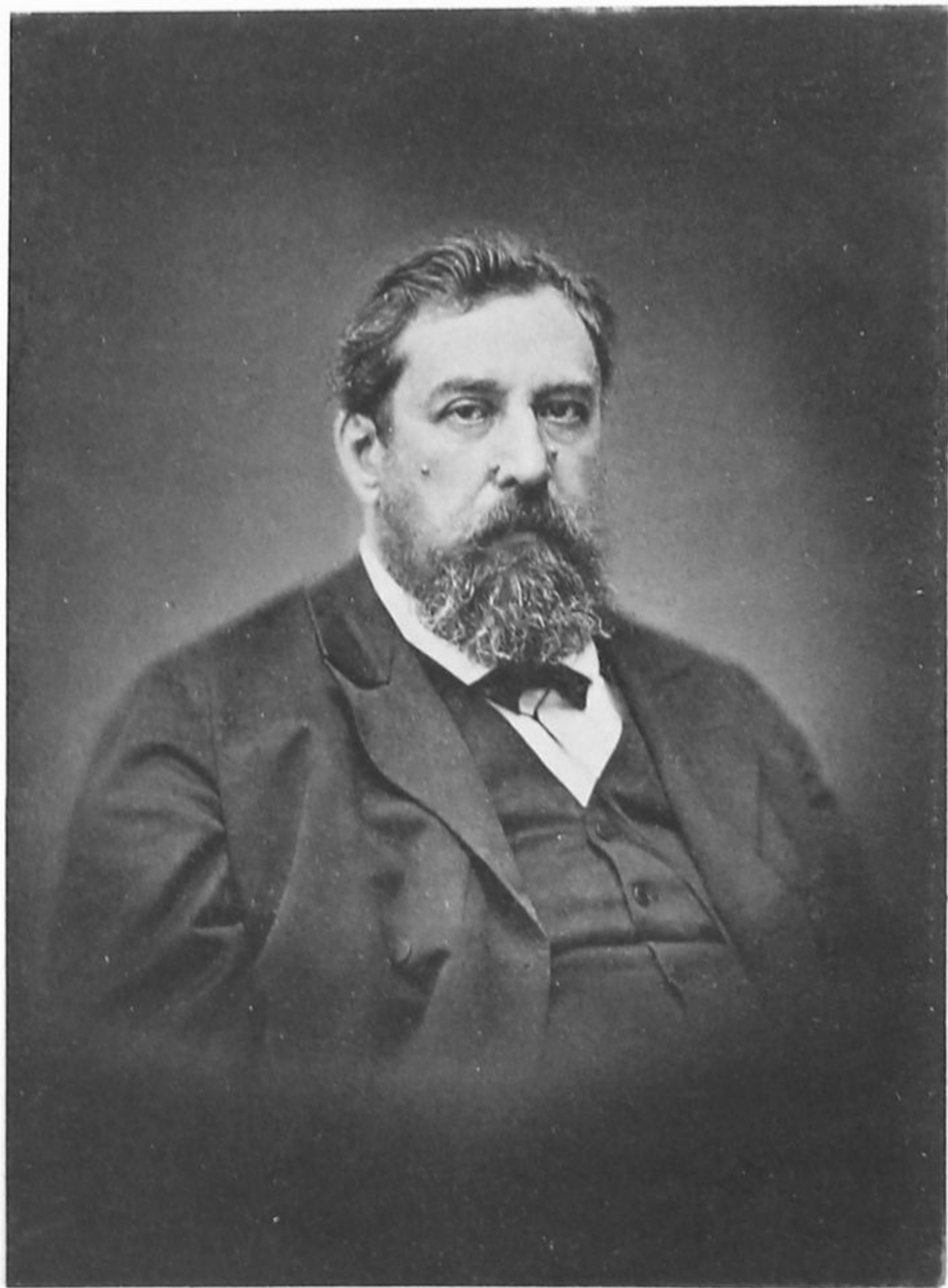
Фото-Гравюра Шерера, Небогосп. и К о в Мюнхен.